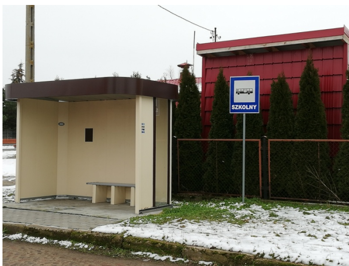
Zdjęcie nr 6 – Przystanek autobusowy przy drodze gminnej

Wieś oddalona jest o 7 km od miasta gminnego i 18 km od miasta powiatowego. Dzięki działającym liniom autobusowym mieszkańcy mogą z łatwością dotrzeć do tych miejscowości by załatwić niezbędne sprawy.