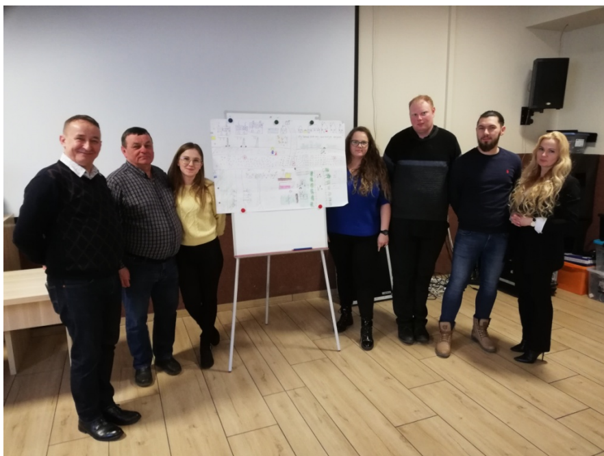
Zdjęcie nr 20 - Prezentacja wizji obrazkowej miejscowości