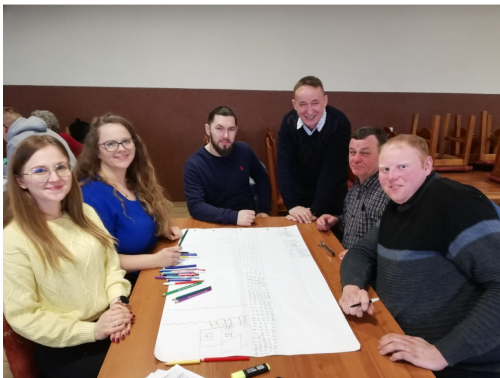
Zdjęcie 22 - Praca przedstawicieli GOW nad stworzeniem wizji obrazkowej