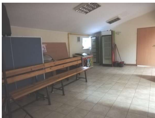
Zdjęcie nr 13 – Wnętrze świetlicy wiejskiej