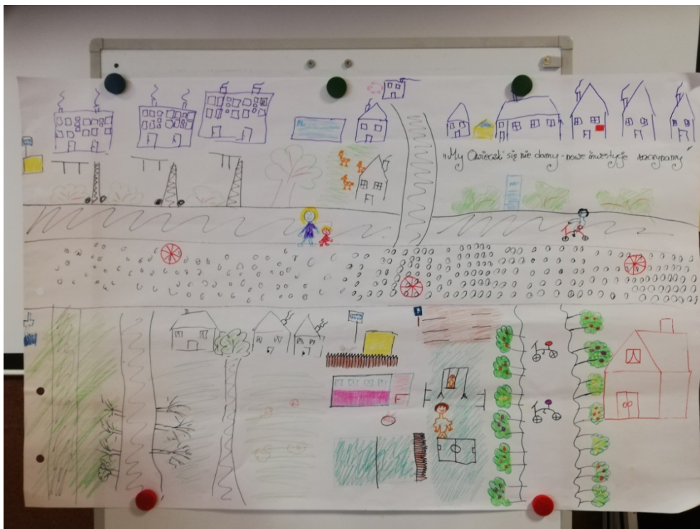
Zdjęcie 21 Wizja obrazkowa miejscowości wykonana podczas warsztatów przez Przedstawicieli GOW