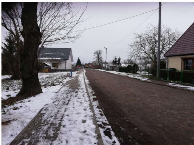
Zdjęcie nr 5 – Droga gminna przebiegająca przez centrum miejscowości

Owieczki - wydawałoby się, wytłumaczenie tej nazwy jest bardzo proste - pochodzi od zwierzęcia jednak tutaj jest inaczej. Nazwa miejscowości związana jest z przydomkiem rycerskim, który, jak wskazują podania historyczne, miał na tych terenach założyć osadę. Historyczne zapisy dotyczące wsi dowodzą, iż najważniejszymi osobami, które dały początek wsi to rodzina Kosmoskich.