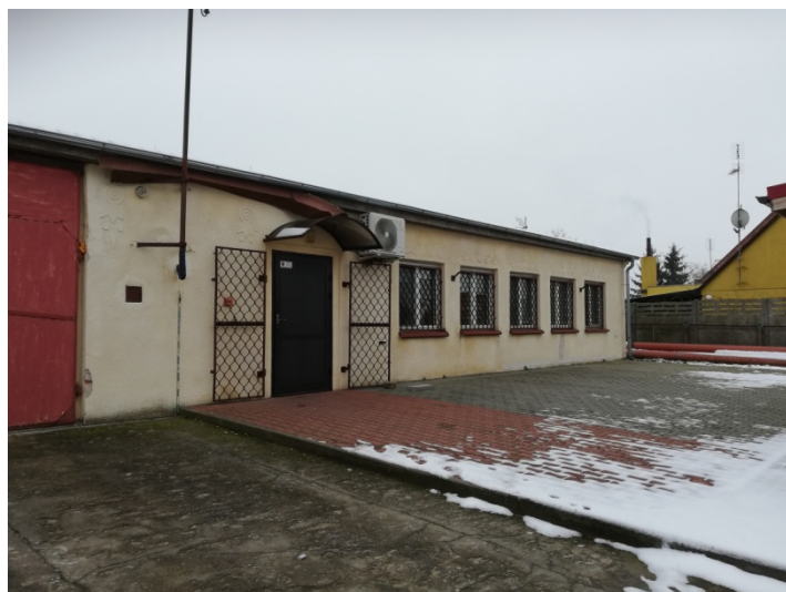
Zdjęcie nr 8 – Sala wiejska

W Owieczkach centralnym punktem jest sala wiejska i teren obok niej, na którym znajduje się plac zabaw (2022 rok), boisko sportowe. Są to miejsca sprzyjające rekreacji mieszkańców. To właśnie w tym miejscu odbywają się najważniejsze wydarzenia i imprezy sołeckie.