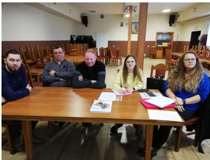
Zdjęcie nr 3 – Praca grupy podczas pierwszego dnia warsztatów

Pierwszego dnia warsztatów członkowie grupy pracowali nad określeniem analizy zasobów . Na podstawie tego dokumentu wskazywali elementy, które oceniają jako silne strony sołectwa i słabe – wymagające zmiany. Wskazywali również na to, jakie szanse i zagrożenia płyną z otoczenia zewnętrznego, które mogą zostać wykorzystane lub ograniczać rozwój sołectwa. W ten sposób przeprowadzono analizę SWOT - analizę, która identyfikuje i wskazuje silne i słabe strony sołectwa, oraz szanse i zagrożenia jakie mają oddziaływanie na sołectwo. Analiza ta uwzględniała poprzedni dokument, który obecnie uległ modyfikacji ze względu na realizację wcześniej zaplanowanych zadań i powstałych nowych oczekiwań mieszkańców do sytuacji panującej obecnie w sołectwie. Każda z wykazanych, obecnie występujących cech, została przypisana do jednego z obszarów potencjału rozwojowego. Są to: Standard życia, Jakość życia, Tożsamość wsi i wartości życia wiejskiego, a także Byt. Uczestnicy warsztatów przeprowadzili również analizę potencjału rozwojowego . Pozwoliło to wskazać najważniejsze cele ogólne oraz zaplanować rozwój tak, aby był on równomierny i wykorzystywał wszystkie obszary interwencji. Finalnie Grupa Odnowy Wsi wskazała wizję hasłową i wizję opisową sołectwa.