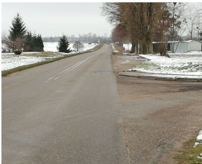
Zdjęcie nr 1 – Droga dojazdowa do miejscowości