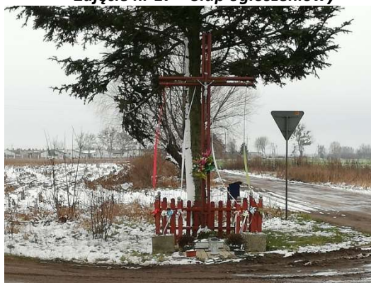
Zdjęcie nr 19 – Przydrożny krzyż