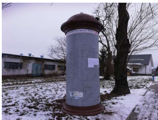
Zdjęcie nr 17 – Słup ogłoszeniowy