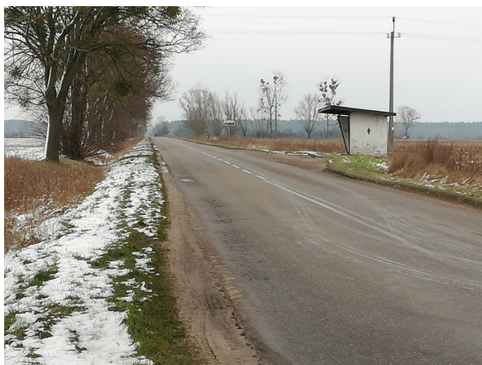
Zdjęcie nr 7 – Przystanek autobusowy przy drodze powiatowej

W Owieczkach centralnym punktem jest sala wiejska i teren obok niej, na którym znajduje się plac zabaw (2022 rok), boisko sportowe. Są to miejsca sprzyjające rekreacji mieszkańców. To właśnie w tym miejscu odbywają się najważniejsze wydarzenia i imprezy sołeckie.