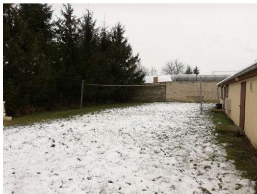
Zdjęcie nr 15 – Boisko do siatkówki