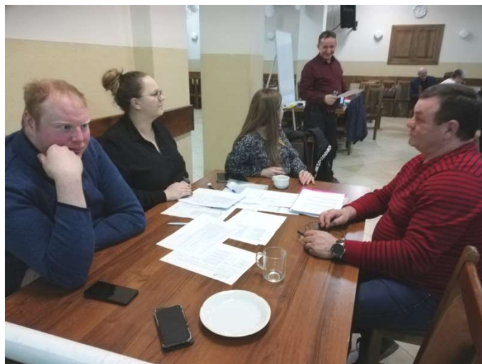
Zdjęcie nr 4 – Praca grupy podczas drugiego dnia warsztatów

Drugiego dnia warsztatów mieszkańcy zobowiązani byli wskazać, na podstawie przeprowadzonych wcześniejszych analiz w poszczególnych obszarach rozwojowych sołectwa, planowane zamierzenia projektowe. Tak powstał plan długo i krótkoterminowy rozwoju sołectwa Wielołęka na najbliższy rok i 5-lat. W planie krótkoterminowym wskazano te projekty/zadania, które mieszkańcy sołectwa planują zrealizować w pierwszej kolejności – w okresie 12 miesięcy. Następnie w ramach planu długoterminowego zaplanowano zadania na lata przyszłe. W planie długoterminowym wskazano cele jakie sołectwo określiło dla realizacji Wizji Rozwoju Sołectwa . Cele zostały postawione w poszczególnych obszarach interwencji, które Grupa Odnowy Wsi postanowiła osiągnąć poprzez realizację zadań i projektów zapisanych w planie długoterminowym i programie krótkoterminowym.