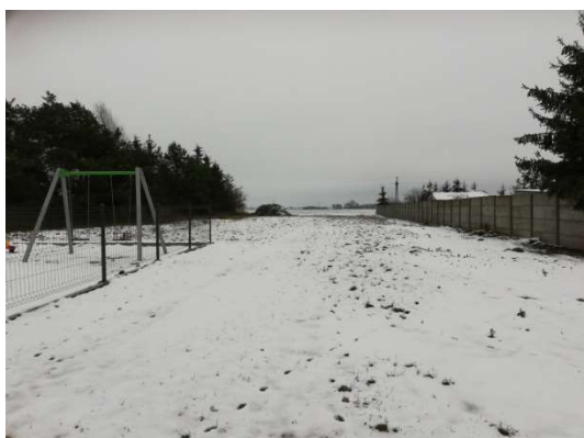
Zdjęcie nr 16 – Teren do zagospodarowania