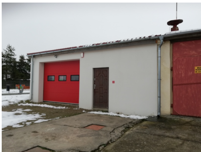
Zdjęcie nr 10 – Garaż OSP przy świetlicy wiejskiej