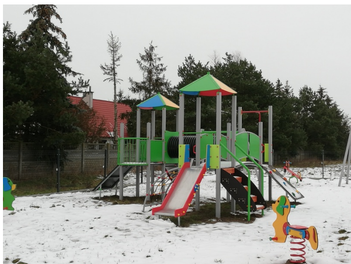
Zdjęcie nr 9 – Plac zabaw przy świetlicy wiejskiej