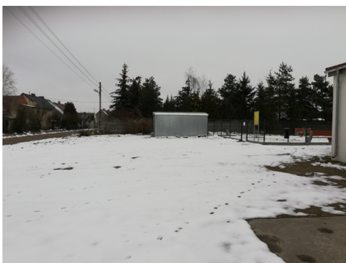
Zdjęcie nr 11 – Parking przy świetlicy