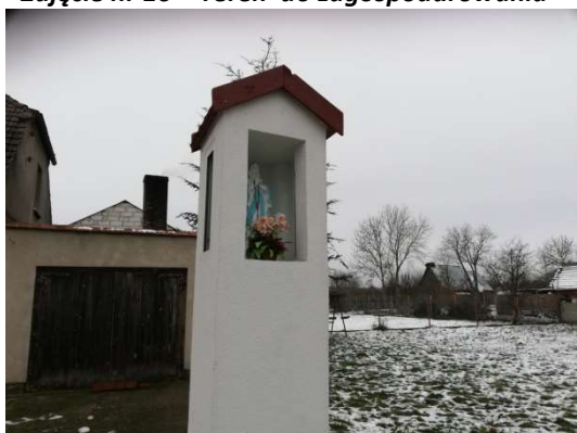
Zdjęcie nr 18 – Kapliczka przydrożna