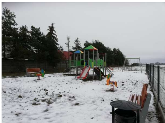
Zdjęcie nr 14 – Teren rekreacyjny przy świetlicy