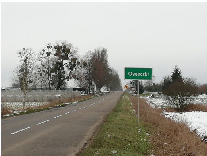
Zdjęcie nr 1 – Wjazd do miejscowości