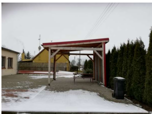
Zdjęcie nr 12 – Altana przy świetlicy wiejskiej